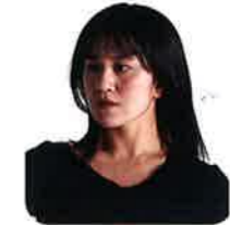
えとう ももこ 衛藤 桃子 (ダンサー)