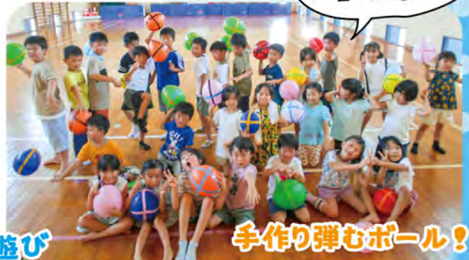
手作り弾むボール！

詳しい行事内容は、各児童館・児童センターからのお知らせ・ホームページをご覧ください。