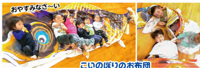
こいのぼりのお布団

自然いっぱいの環境の中で、毎日のびのびと過ごしている子どもたち。職員は、子どもの“やってみよう”という気持ちが形になるように、子ども一人一人の思いを十分に聞き、意見を言い合える場を多く設け、子どもの興味や意欲を引き出しています。また、からだを使ってやってみる・感じてみるという「体験」も大切にしています。