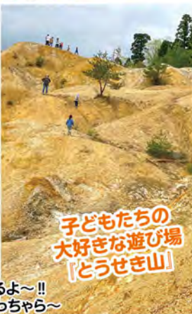
子どもたちの 大好きな遊び場 『どうせき山』