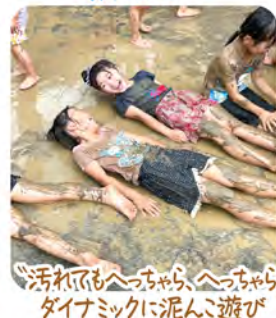
“汚れてもへっちゃん、へっちゃん、ダイナミックに泥んこ遊び”

“豊かな遊びこそ学び、ととらえ、夢中になって遊べる内的・外的環境を整え、子ども達があくまでも生活や遊びの主体者となって進めていける保育を目指しています。”