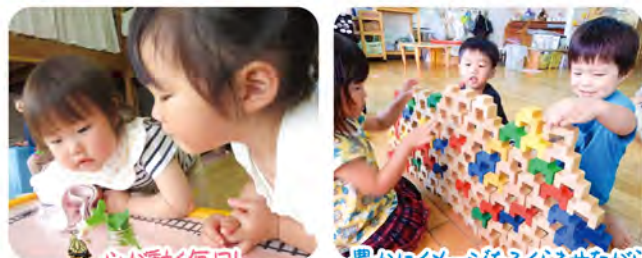
心が動く毎日! 何を見つめているの…