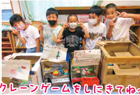
クレーンゲームをしにきてね〜