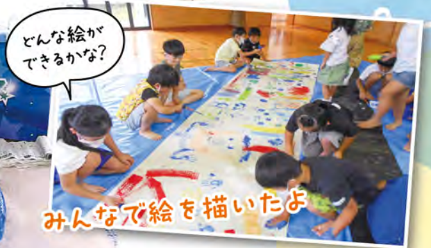
どんな絵が描けるかな?