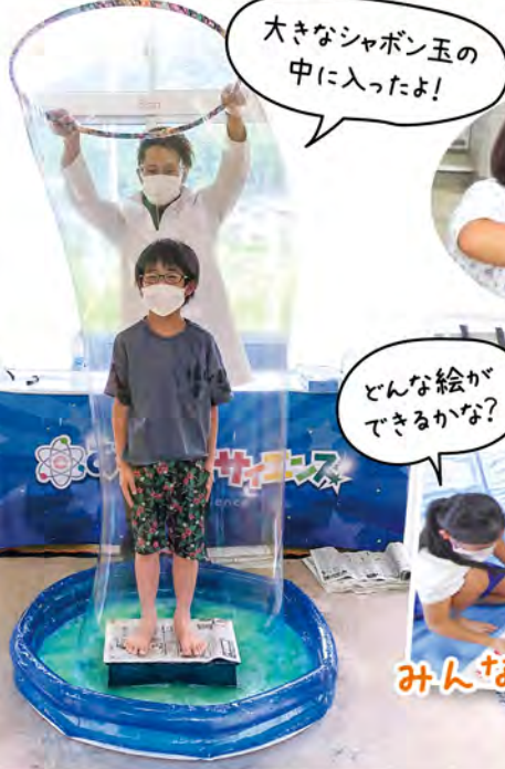
大きなシャボン玉の中に入ったよ!