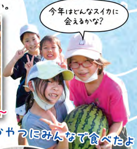
今年とはどんなスイカに会えるかな?