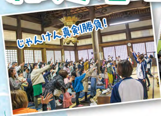
じゃんけん真剣勝負!