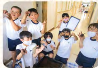
カブトムシがたくさん羽化したよ