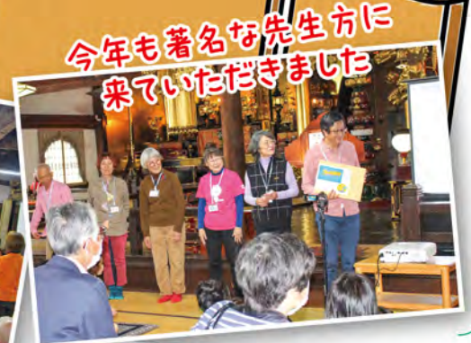
今年も著名な先生方に 来ていただきました