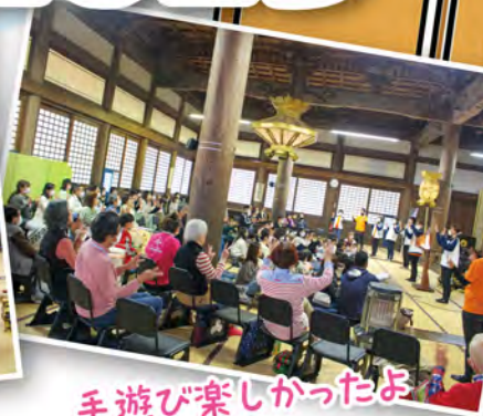
手遊び楽しかったよ