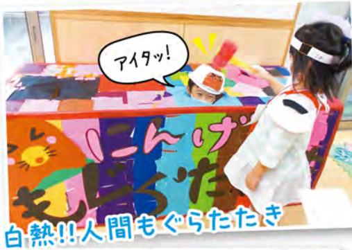
白熱!!人間もぐらたたき

詳しい行事内容は、各児童館・センターからのお知らせ、ホームページをご覧ください。