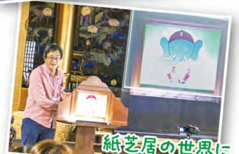
紙芝居の世界に 引き込まれる すてきな回演でした