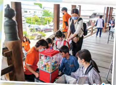
ガチャガチャ何が出るかな〜