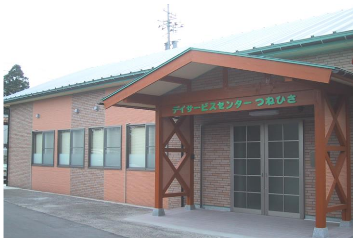
デイサービスセンターつねひさ 利用料金一覧

デイサービスセンターつねひさでは、定員 12 名という少人数で、家庭的な落ち着いた雰囲気をお大切に、ご利用者様一人ひとりが安心して過ごせる時間を提供させていただきます。