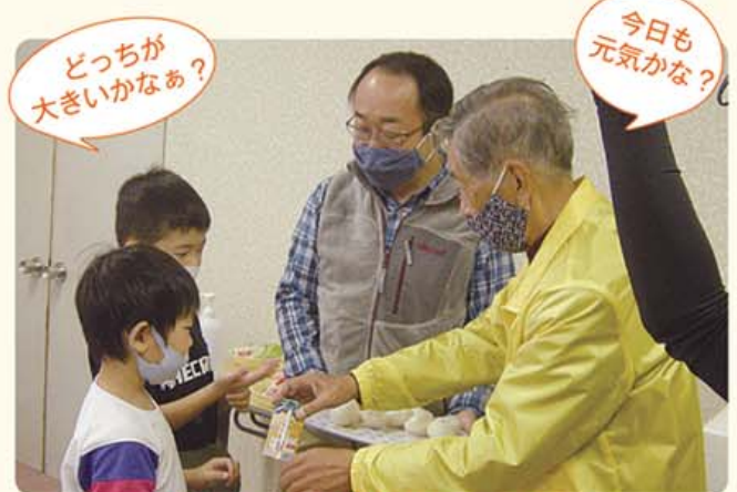
おむすびが結ぶ地域と子ども