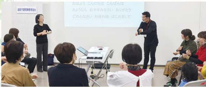
昨年のボランティアの集いの様子