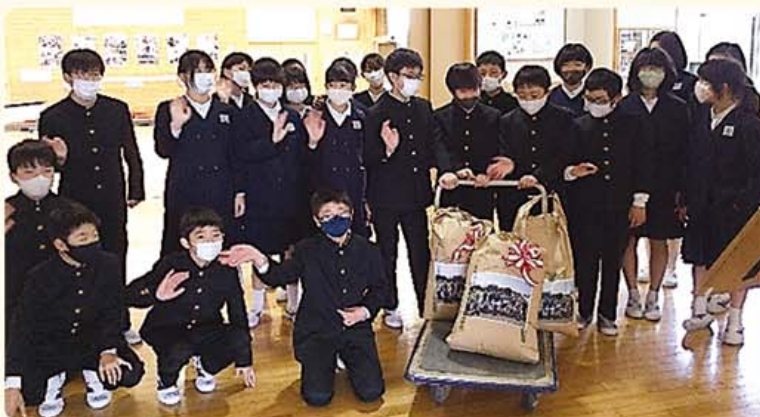
北新庄小学校で栽培した「いちほまれ」80 kgの寄付

コミュニティを「何気なくハイリスク者に出会い、理解し合う関係」へと深化させることを目指し、地区ネットワーク会議、町内福祉連絡会などの圏域による活動を、福祉意識の醸成や専門機関等とのネットワークを構築する機会と捉え、誰にも訪れる人生の道筋に沿った、多種多様な活動を実施した。