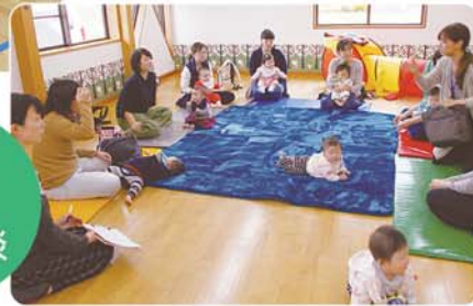
保健師による育児相談