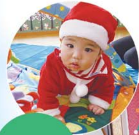
サンタさんに変身!