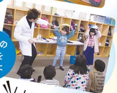
静電気の 実験を したよ