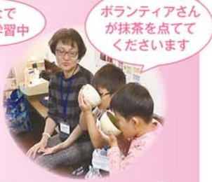
みんなで真剣に学習中