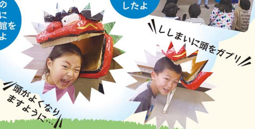
頭がよくなり ますように...