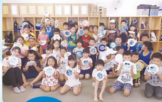
夏休みの 思い出に ミニ水族館を 作ったよ