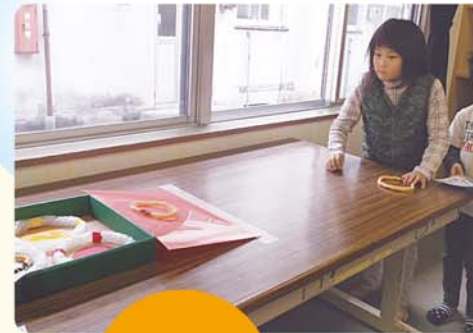
クリスマスゲーム大会