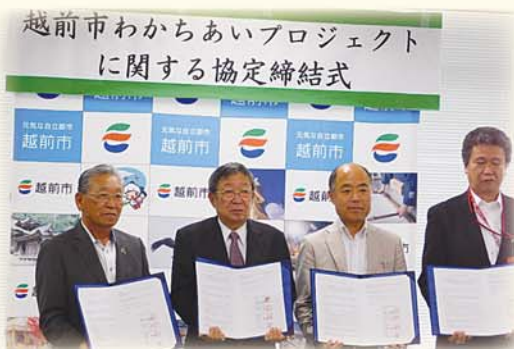
越前市わかちあいプロジェクトに関する協定締結式 (平成30年9月25日)