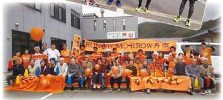
介護施設の皆様から応援をいただきました