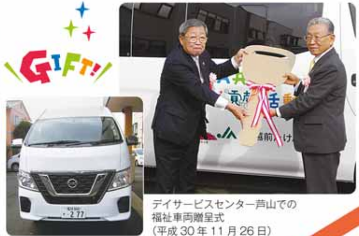
デイサービスセンター芦山での 福祉車両贈呈式 (平成30年11月26日)