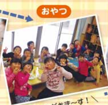
おやつ / いただきま〜す！