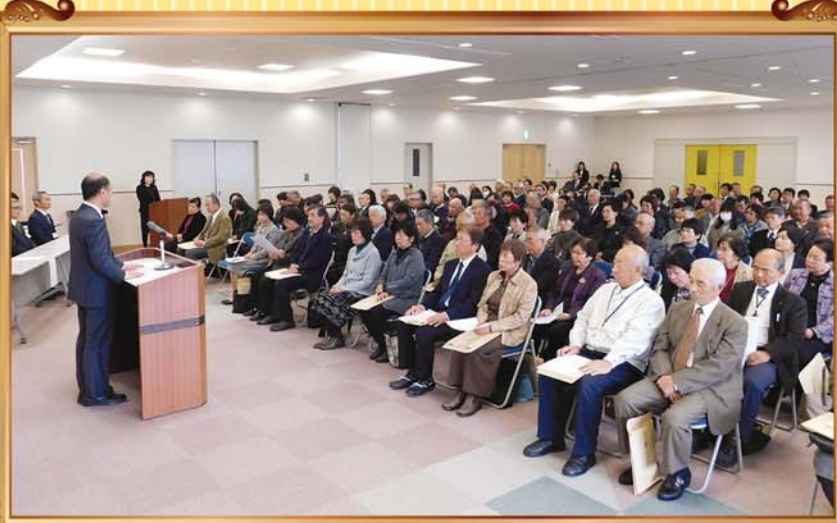
平成28年12月5日「民生委員・児童委員委嘱式」

12月1日越前市では191名の民生委員・児童委員が活動されています。東地区(1地区)、西地区(2地区)、南地区(3地区)、神山・王子保・坂口・白山地区(4地区)、吉野・大虫地区(5地区)、国高・北新庄地区(6地区)、北日野・味真野地区(7地区)、今立地区(8地区)のブロックに分かれ、毎月1回定例会で、勉強会や情報交換会が開催されています。公民館、自治振興会、学校行事などにも関わっており、民生委員・児童委員の方々はとても身近な存在です。