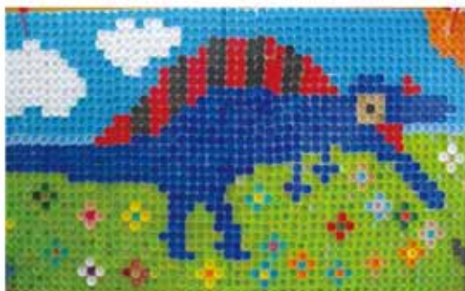
タイトル 「僕の1番好きな恐竜スピノサウルス」 大きさ 180 cm × 90 cm エコキャップ 5300 個使用