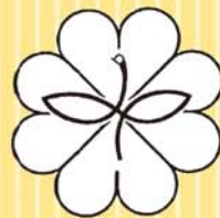
民生委員・児童委員のマーク