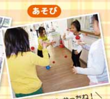
あそび / 今日も楽しかったね！