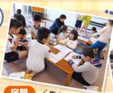
宿題 / 集中、集中！