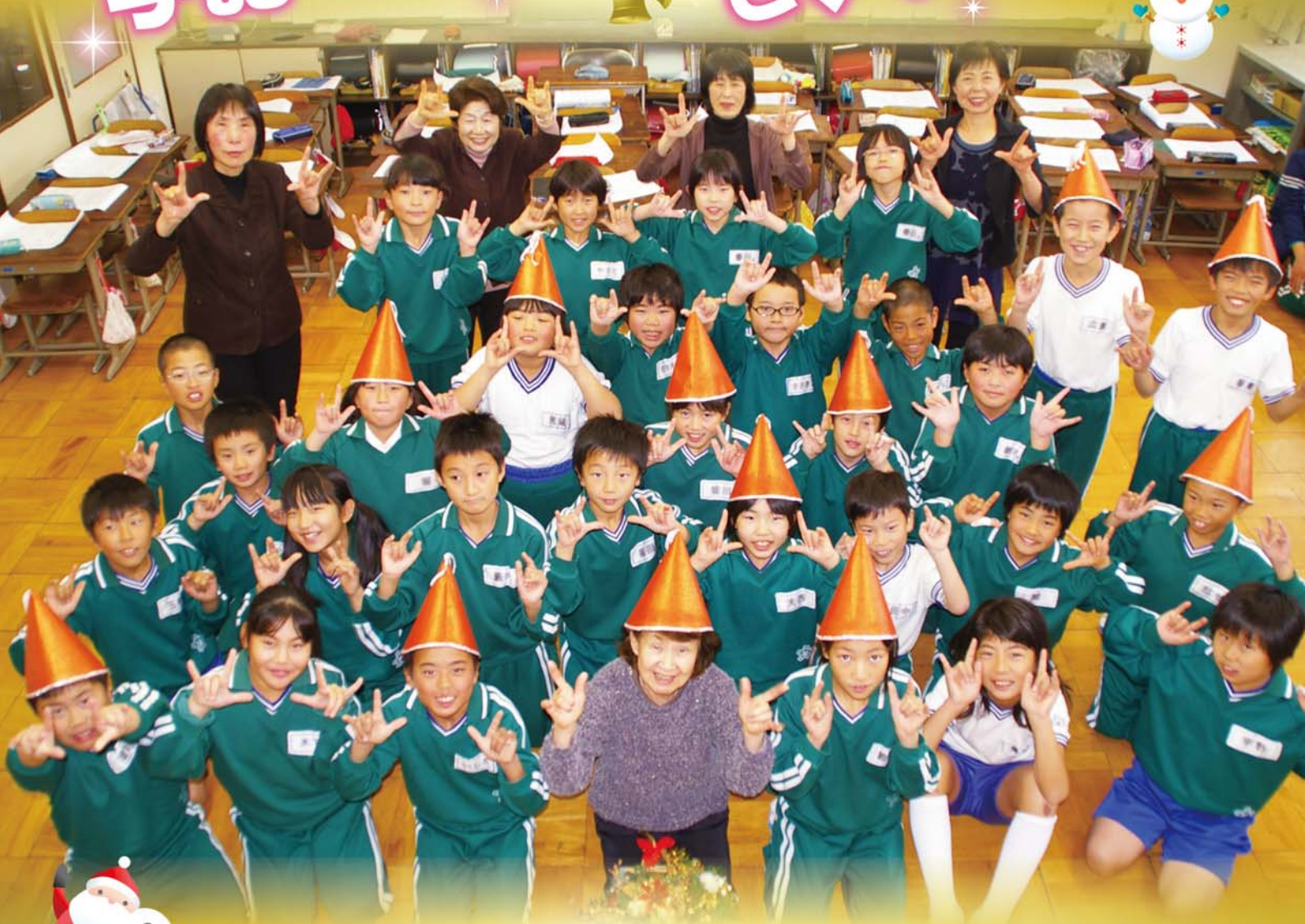
花筐小学校4年生の「福祉体験学習」 手話サークルホトトギスのみなさんとともに