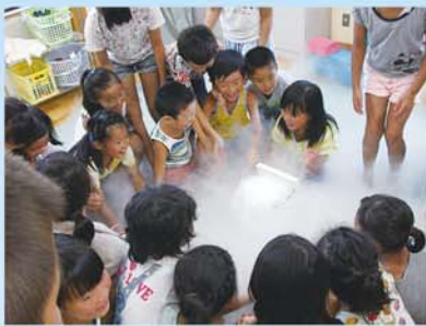
わぁ～何が出てくるのかな？

児童館からのやくそく *遊びに来るときは、飲み物(お茶など)を必ず持ってきましょう *貴重品(ゲームやお金)は持ってこないようにしましょう