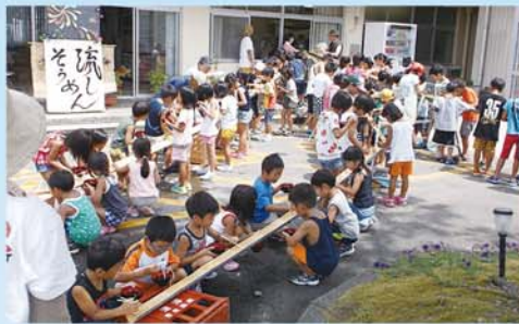
みんなで食べると美味しいね☆