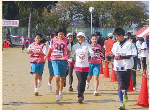
H27年度 福祉教育推進校 武生第三中学校 「菊花マラソンで障がい者ランナーの 伴走ボランティア」