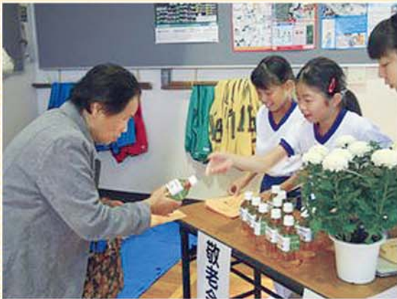
H27年度 福祉教育推進校 坂口小学校 「地区敬老会のお手伝い」

※2校の取り組みについては、今後の社協だより紙面上で紹介していく予定です。どうぞご期待ください。