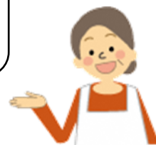
民生委員・児童委員