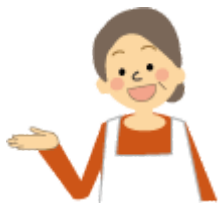
民生委員・児童委員