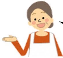
民生委員・児童委員

福祉推進員さんの家からは、かなり距離があるので、普段の見守りは難しいかも知れませんね。