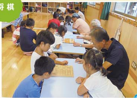
ム、ム、おじいちゃん強い!