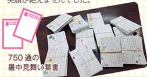
750通の暑中見舞い葉書

公民館と連携して、3年から6年が南地区のお年寄りに暑中見舞いの葉書を書きました。そしてお返事を下さった82名を学習発表会に招待しました。久しぶりに入る学校の体育館で、隣りの人と話し込んだり、発表に大きな拍手を送ったり笑顔が絶えませんでした。