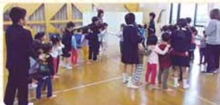
園児に交わり楽しくジャンケン列車

ボランティアクラブが高瀬保育園を訪問し、ゲームや紙芝居、踊りなどをいっしょに楽しみました。どう話せばわかってもらえるのか、何をすると反応してくれるのか、よく小さい子の表情を見ながら考えて行動していました。