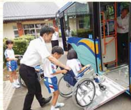
車イスの運転難しいな