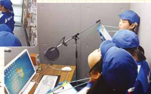
スタジオ内はこのようなになっているのか!