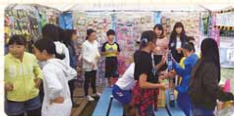
紫式部公園で出店

10本の空き缶を積んで見事成功すると、くじを引き景品がもらえるという「Dream Land」を開きました。最初は声をかければいいのか戸惑っていましたが、慣れてくると上手に助けてあげながら「うま〜い」「よっしゃあ」など、いっしょに喜んでいました。