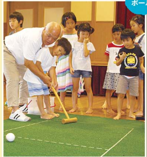
やさしく教えてくれて ありがとう