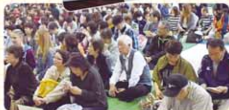
招待席から久しぶりの学校を楽しめる