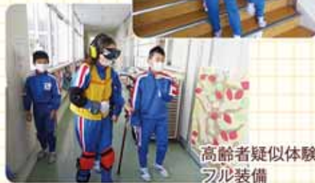
高齢者疑似体験刃形装備