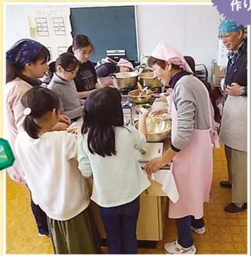
こんなの初めて! めっちゃおいしい♡