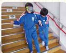
アイマスクで階段

高齢者の体の不自由さを少しでもわかってもらうと、見えにくいゴーグルやおもりをつけたり、完全に目を覆うアイマスクをかけたりして校舎を歩きました。友達があつちりつかんでくれているので何とかまっすぐ歩けていましたが、階段などは落ちてしまうという恐怖で体が震えるほどでした。お年寄りとの交流会では、相手の立場に立って親切に接することができるという事です。