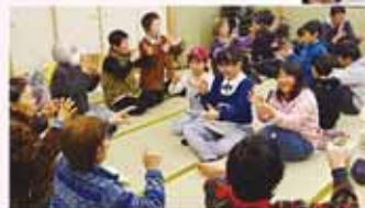
岩内町でのサポート

みなさんの心身の状態にあわせ、介護予防のためのケアプランを作成したり、必要な事業や自主的にできる取り組みをご紹介します。また、各町内で開催されている高齢者のサロンにもおじゃまさせていただき、少し体に衰えを感じ始めた方も、お元気で過ごせるよう手伝いをしています。