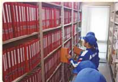
点字図書館なんてはじめてだ!

新聞や週刊誌なども点字にしてありビックリしました。スタジオ内も見せていただき、音訳のボランティアがどのような活動をするのか解りました。