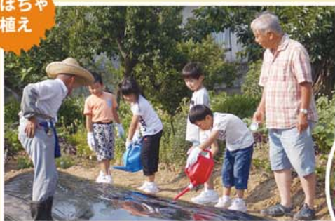
かぼちゃってこうやってつくるんだ!