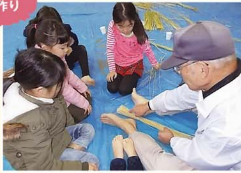
わらが縄になるなんてスゴイ!