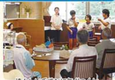
懐かしい手遊びに気がつくど 一緒に手を動かして...

わかば学級の3人の児童が、福井赤十字病院緩和ケアで開かれた七夕会に参加しました。みんながアリになって絵本から飛び出す読み聞かせに、会場は一気に温かな空気に。「七夕」や「かたつむり」の手遊び歌など、つかの間でしたが患者さんたちとやさしい時間を一緒に過ごさせていただきました。