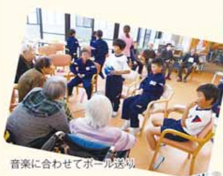
音楽に合わせてボール送り

11月中旬に南中山小学校4年生児童が「福祉の学習授業」でデイサービス事業所を訪問しました。ゲームや和紙のしおりを一緒に作り、ご利用者様の方からの質問にも笑顔で答えていました。児童たちは、人生の大先輩にとっても礼儀正しく接し、ご利用者も本当に楽しいひとときになりました。Win-Win♡