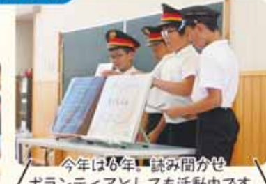
今年は16年！読み聞かせ ボランティアとしても活動中です。

読み聞かせ活動も今年で3年目。いろいろな施設で、行事で、たくさん笑顔を見ると、自信をもって読み聞かせができるようになりました。