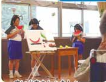
すいかをむしゃむしゃ 思わず和やかな笑い声