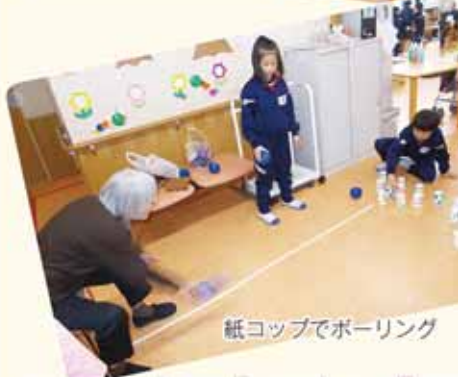
紙コップでボーリング