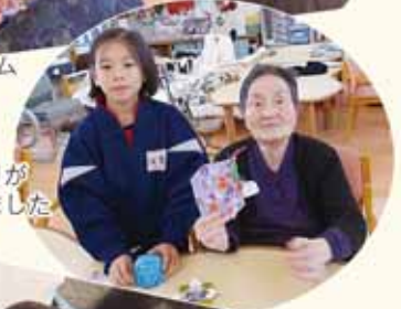
しおりが出来ました