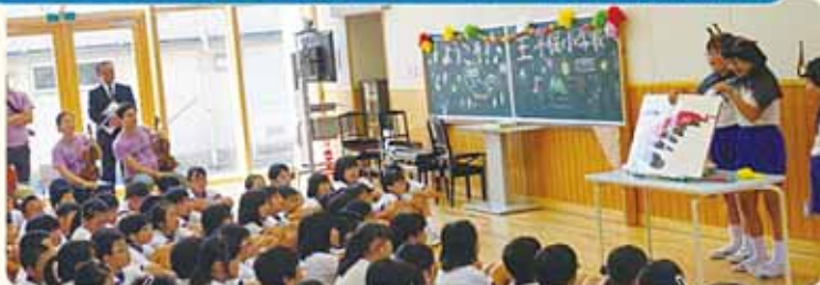
外国のお客様には英語も入れてがんばりました！